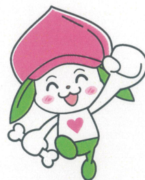
協会けんぽ福島支部マスコットキャラクター ケンタくん